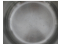
Pată după curățare