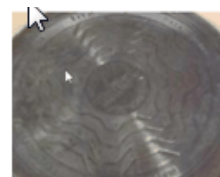
Decolorare a bazei externe