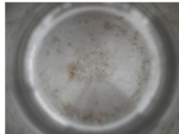
Pată înainte de curățare