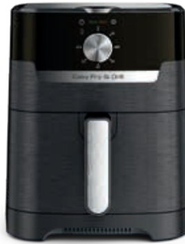
EASY FRY & GRILL CLASIC