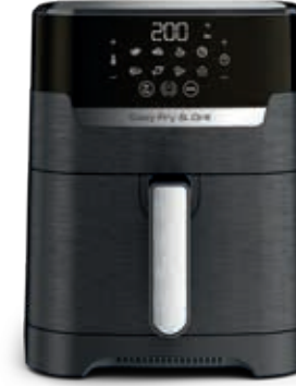
EASY FRY & GRILL PRECISION