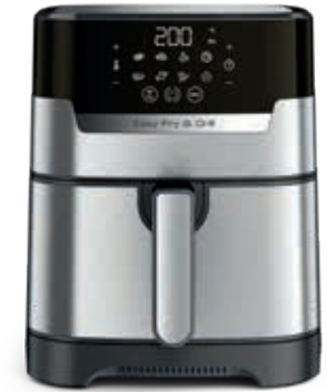
EASY FRY & GRILL PRECISION+