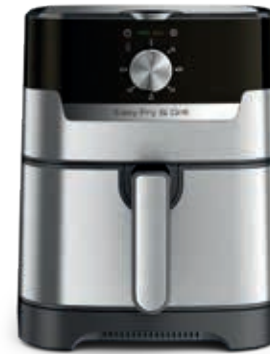
EASY FRY & GRILL CLASIC+